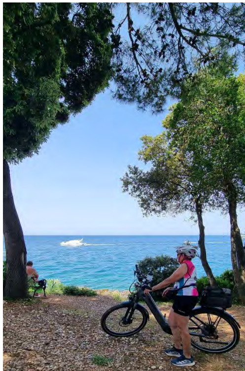
Triest nach Pula