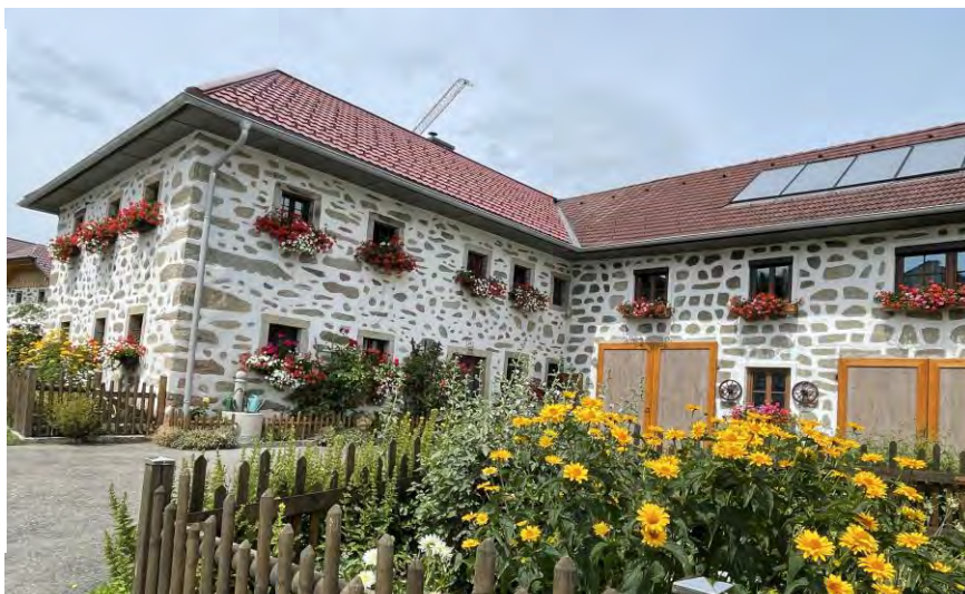
Ein typisches „Steinblosshaus“