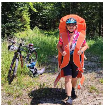
Sonderprüfung mit Rucksack