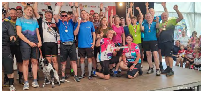
Gewinner der Schnitzeljagd