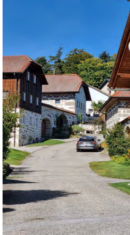
Steinblossrunde im Mühlviertel